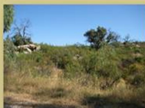
Zona de bolos graníticos