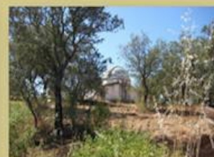
Construcción en finca Puerto Marte