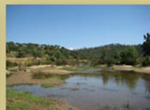
Paraje de La Rivera de Cala